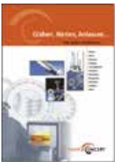
Prospekt: Glühen, Härten, Anlassen