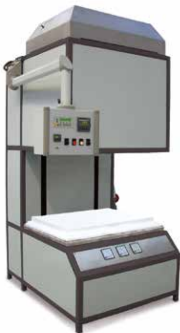
Hochtemperatur-Haubenofen bis 1800 °C