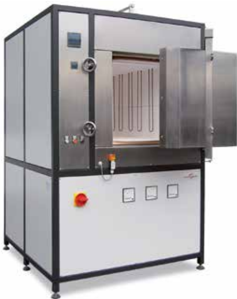
Hochtemperatur-Kammerofen bis 1800 °C