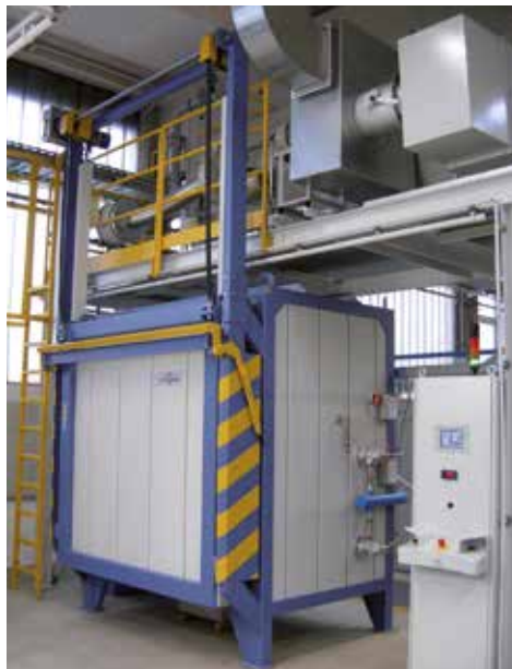
Gasbeheizter Kammerofen zum Entbindern und Sinter in einem Prozess, mit thermischer Abluftreinigung