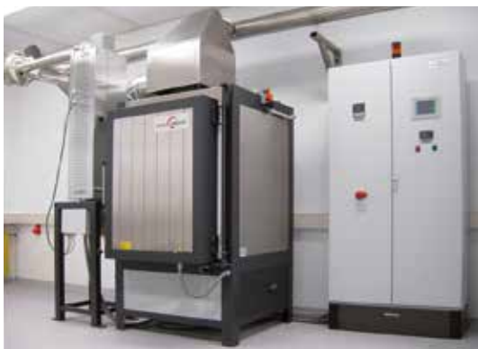
Kammerofen bis 1400 °C zum Entbindern und Sinter in einem Prozess, mit katalytischer Abluftreinigung