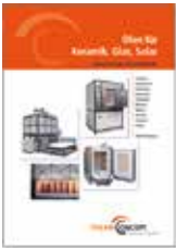
Prospekt: Keramik, Glas, Solar