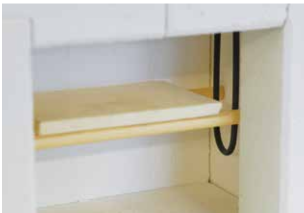
2. Beschickungsebene bei Ofen bis 1500 °C