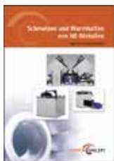
Prospekt: Schmelzen und Warm- halten von NE-Metallen